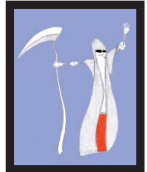
Kl. 6b, M.A.-Nexö-Schule Briesen