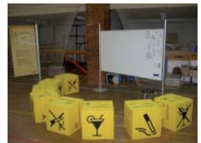
Wie soll das alles in einen Koffer passen?

Über die genauen Bestellkonditionen werde ich Sie in einem der nächsten Info-Briefe informieren.