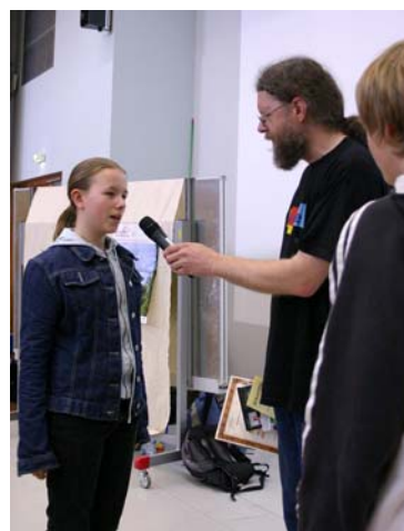
Sonderpreis im Zusatzwettbewerb an die Klasse 7/1 des Fontane-Gymnasiums Strausberg für ihr tolles Video