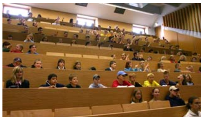
Blick in den Zuschauerraum des Hörsaals Nr. 4 in der Europauniversität Viadrina Frankfurt (Oder)