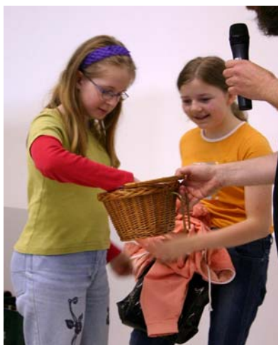
Die beiden Glücksfeen bei der Arbeit