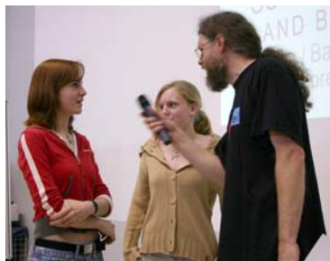
Der 1. Preis ging an die Klasse 9c des Gauß-Gymnasiums Frankfurt (Oder)