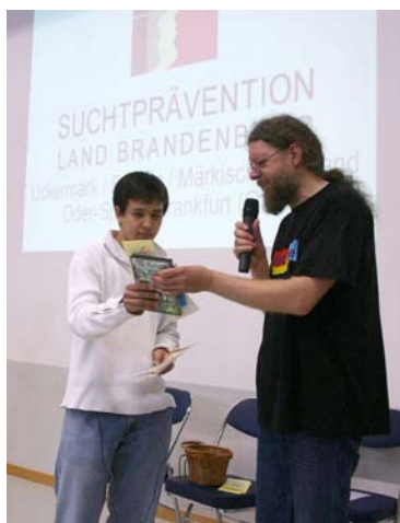
Den 3. Preis erhielt die Klasse 10a des Gauß-Gymnasiums Frankfurt (Oder)