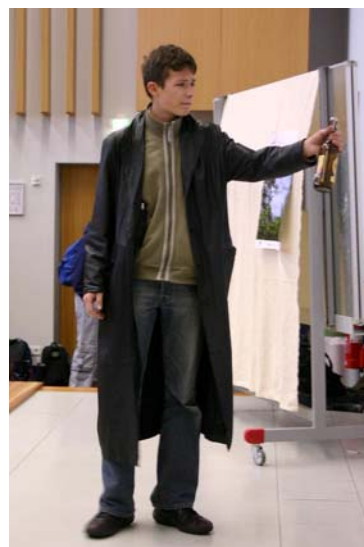
Dieses Stück über den Absturz eines Klassenprimus zum Alkoholiker hatte auf dem Barnimer Theaterwettbewerb im März 2005 den ersten Preis gewonnen.