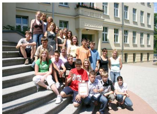
Der 1. Preis ging an die Klasse 8/2 des Fontane-Gymnasiums Strausberg und wurde persönlich an der Schule übergeben